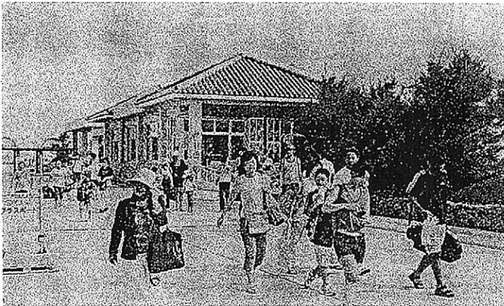
竹富町は、全町体制で観光を推進するため「観光立町宣言」を計画している。＝資料写真

また、観光を町の戦略的産業、総合産業として明確に位置付けるため、全庁、全町民の観光に対する認識を共有し、内外にアピールするために「観光立町宣言」を行う。